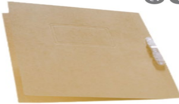
Imagen de muestra

Los documentos deben estar debidamente foliados y ordenados cronológica o consecutivamente según sea el caso. Según lo establecido en las TRD.