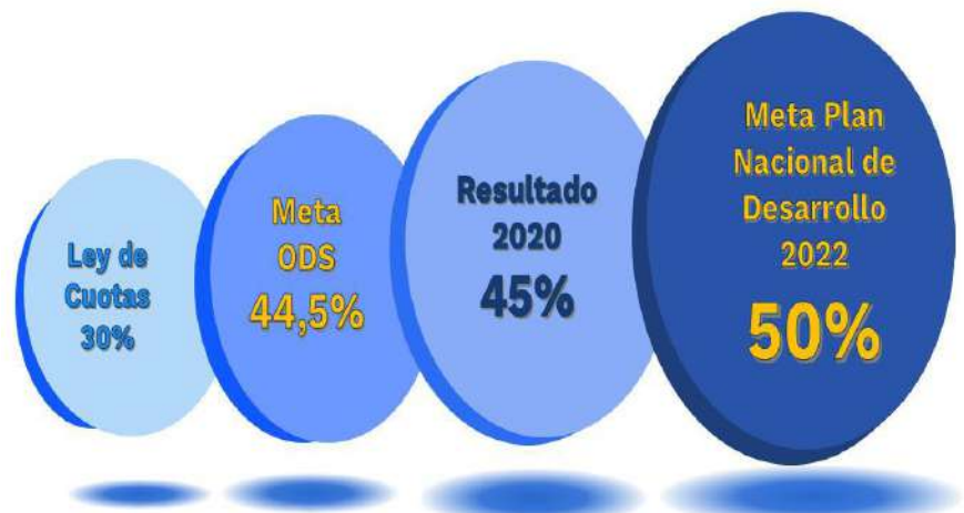
Ilustración 1. Indicadores para tener en cuenta sobre las mujeres ejerciendo cargos directivos en el Estado Colombiano.