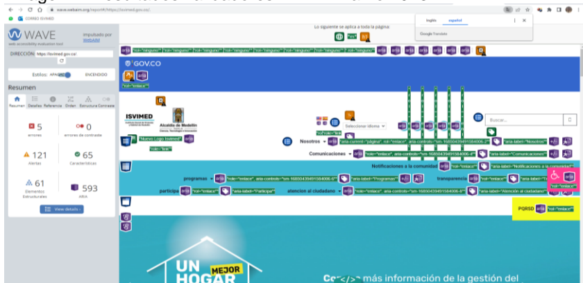
imagen 1. Resultados validadores WAVE marzo 2023

Fuente de información: https://wave.webaim.org/report#/https://isvimed.gov.co/ .