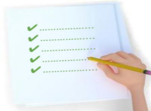
Imagen 1