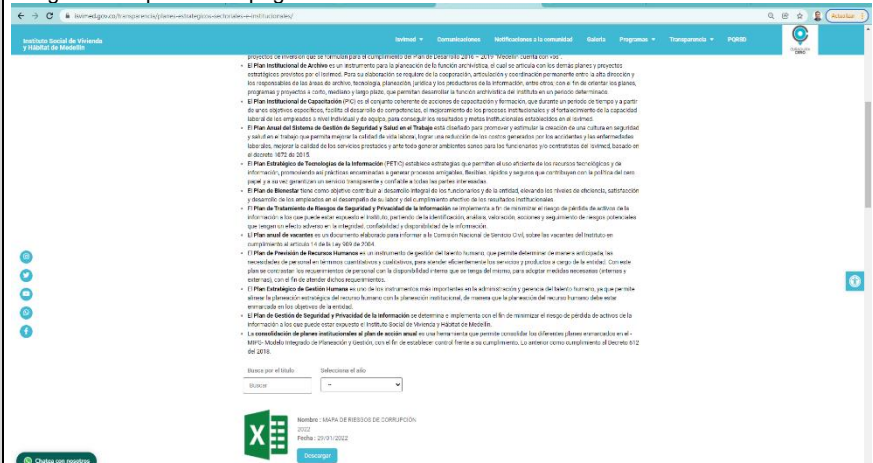
Imagen No. 1 pantallazo página web institucional