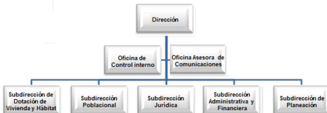
Organigrama ISVIMED 2017

Por otro lado, el Instituto toma el liderazgo y coordinación del Plan Estratégico Habitacional de Medellín 2030, convenio en cabeza del Departamento Administrativo de Planeación y en ejecución con la Universidad Nacional. Dicho Plan, es un instrumento de política pública que busca orientar el quehacer de los actores del sistema habitacional a partir de la definición de una visión que apuesta por territorios integrados, incluyentes, habitables y equitativos.